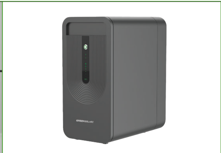
Balkonkraftwerksspeicher 3. Generation Erweiterung 2,24 kWh